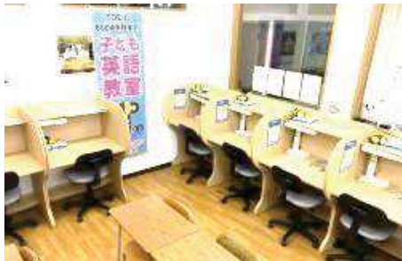
第4教室（通称：自習部屋） 子ども英語Leptonの教室もココ！