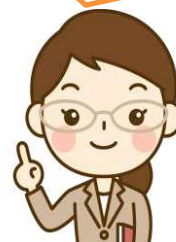
佐原です 個別指導のステキな先生たち