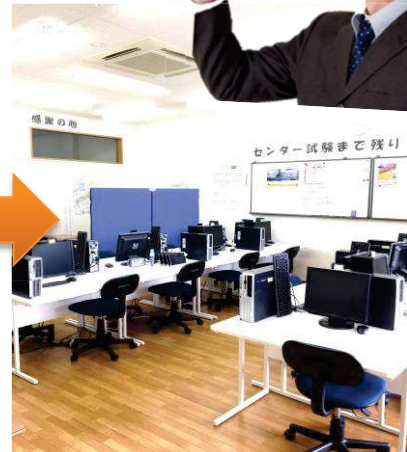
第3教室（通称：高校生の部屋） 高校生ともなると学習は自律型