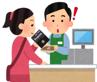
赤字の言葉をご存知ですか？

サポート詐欺とは、PC やスマホの画面に偽の警告画面を表示して、金銭をだまし取ろうとする詐欺行為です。